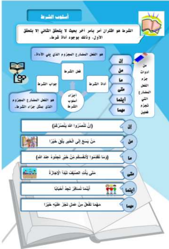
شكل (٢) نموذج لنمط الإنفوجرافيك الثابت في أحد دروس النحو للصف الأول الإعدادي

وفيما يلي يعرض الباحث نموذجاً من تصميمه لنمط الإنفوجرافيك الثابت في تعليم النحو في الصف الأول الإعدادي: